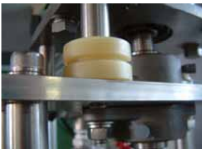
球推型直接动单元