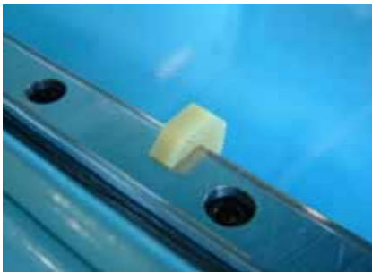
轨道型直接动向导